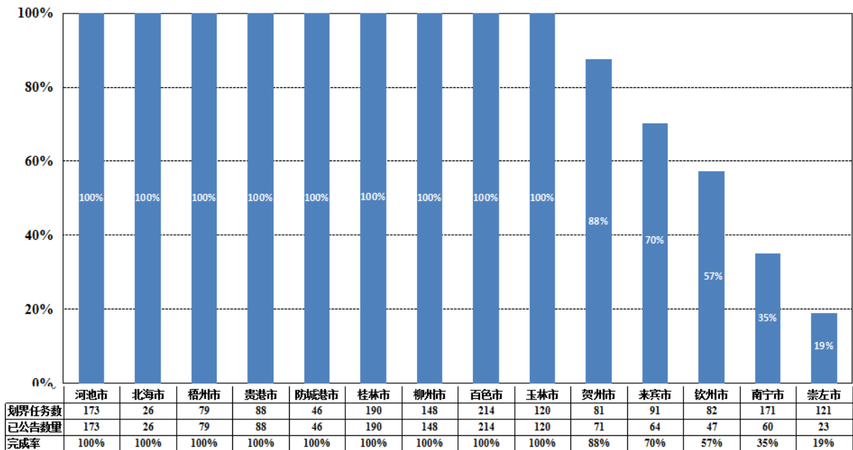
全区2020年50~1000平方公里河流划界公告情况

条，大新县 22 条；南宁市 56 条，分别是邕宁区 3 条，良庆区 2 条，江南区 5 条，兴宁区 5 条，马山县 14 条，横县 27 条，钦州市的钦南区 2 条，来宾市的兴宾区 11 条，贺州市的富川县 3 条。这些河流所在市县再不切实采取强力措施奋力追赶，将难以按要求在 11 月底前全面完成目标任务，影响广西河湖长制工作创先争优。各地工作进展情况如下图及后表所示。